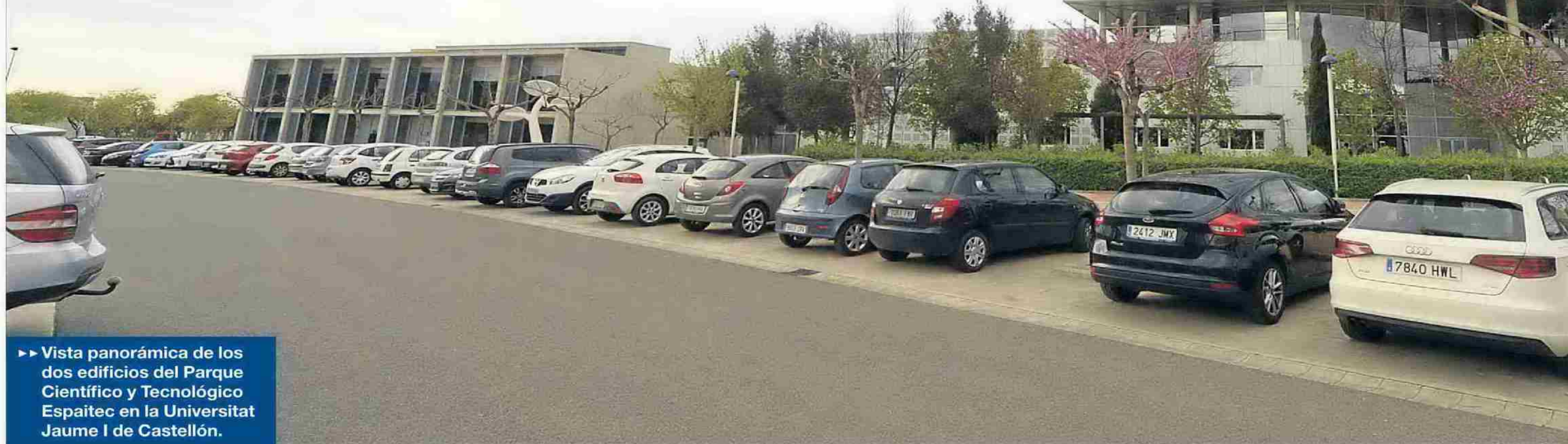
►► Vista panorámica de los dos edificios del Parque Científico y Tecnológico Espatec en la Universitat Jaume I de Castellón.

Espatec , el Parque Científico y Tecnológico de la UJI, cumple diez años con 20 empresas instaladas que emplean a 171 personas y facturan 8,4 millones