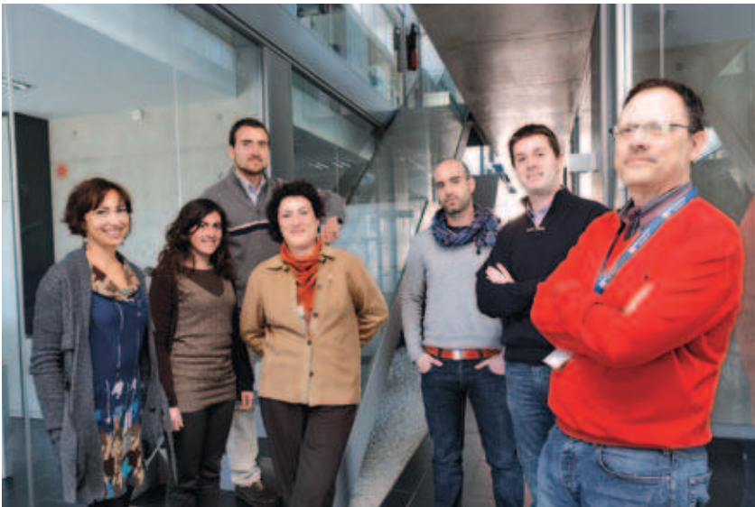
Equipo de trabajo Outcomes10 en las instalaciones del edificio Espaitec1

Su objetivo a corto plazo es tener al menos un estudio en desarrollo para todas las grandes empresas del sector y poder empezar a trabajar para las Administraciones Sanitarias. Es decir, que sus investigaciones ayuden a la toma de decisiones de los gobiernos autonómicos a la hora de invertir en una u otra tecnología sanitaria o fármaco, siempre bajo el punto de vista coste-efectividad y buena calidad de vida para el paciente. Su iniciativa emprendedora pionera en Castellón es una apuesta hacia la economía del conocimiento en la provincia. Según afirma Luís Lizán "El valor añadido de las empresas a través de la ciencia, la tecnología y el conocimiento pueden suponer la diferencia frente a otras empresas del sector ubicadas en otras regiones o países y son el motor de crecimiento. En un entorno de crisis como el actual, únicamente aportando algo diferente y con valor se puede crecer. En nuestro caso, ese valor