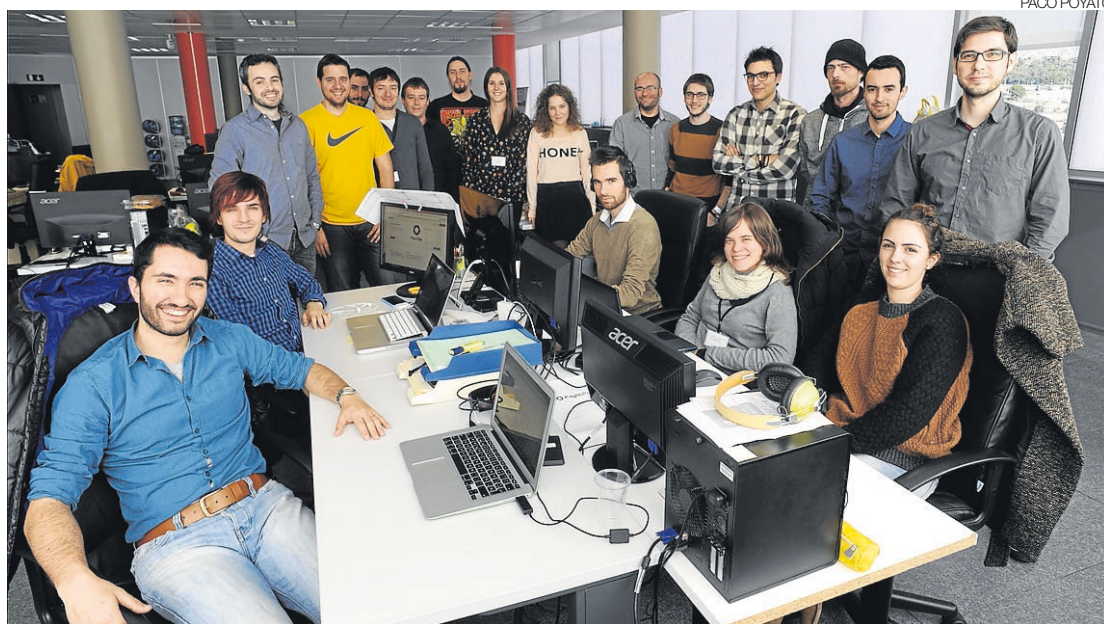
► Equipo humano de la joven empresa PaynoPain que en pocos años ha multiplicado su plantilla.

Pero los logros de esta joven empresa no acaban ahí. Tras horas y horas de investigación han desarrollado una pulsera inteligente que permite que el espectador de un concierto pague su consumición sin necesidad de llevar dinero en efectivo, o han ideado un monedero electrónico, con el que el cliente puede pagar a través del teléfono móvil. Son solo tres ejemplos que han permitido a esta compañía crecer en facturación y en trabajadores. Empezaron con un equipo de tres profesionales. Hoy son 22. ¿Dónde está el secreto? “Quizás en haber sabido rodearnos de gente con mucho talento y