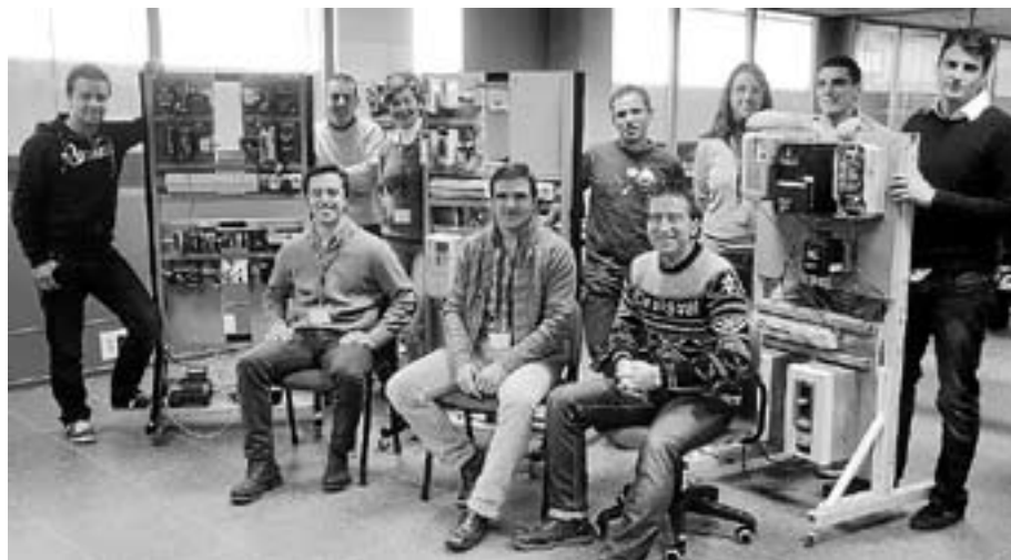
► Ingesom. Nació en octubre del 2006. Tiene 12 trabajadores y 2 líneas de negocio.