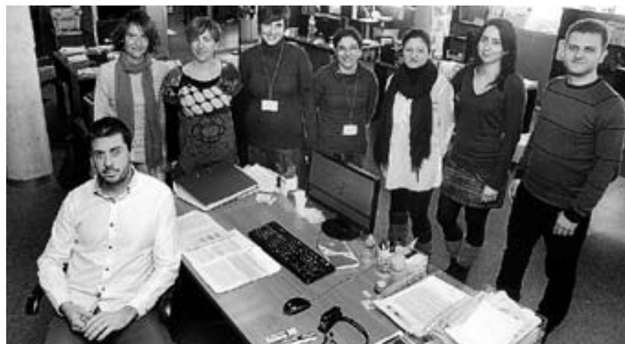
► Outcomes 10. Una empresa en Castellón dedicada a la farmacoeconomía.