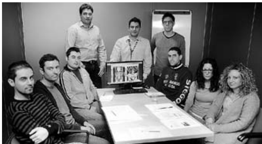
► Actualmed. Desarrolla Sistemas Radiológicos de última generación.

Lo mismo ocurre con Ingesom, la empresa de Espaitec que mayor número de estudiantes en prácticas ha contratado, con impacto real en la creación de empleo cualificado. Su línea en acuicultura tiene una gran presencia en el mercado internacional. ≡