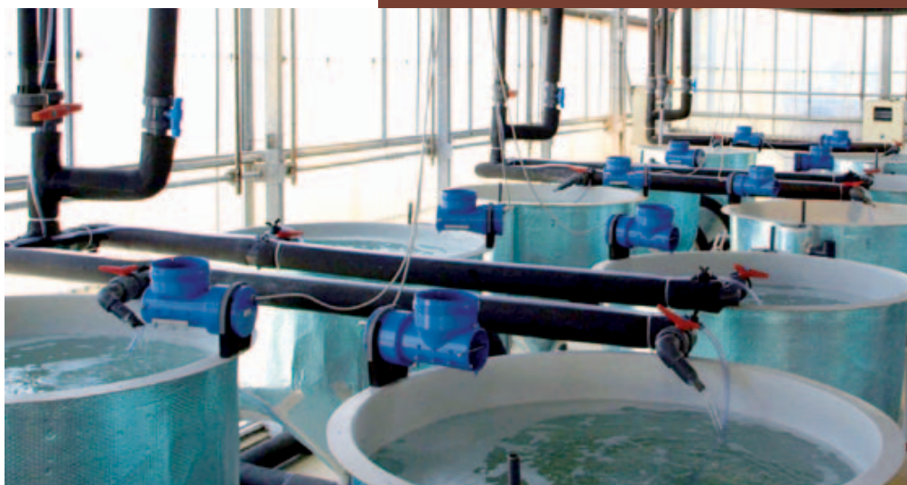
Tanques de peces en IRTA. “Centro de acuicultura del IRTA en Sant Carles de la Ràpita”

Desde siempre, Ingesom ha abordado los proyectos de automatización y software buscando no sólo satisfacer las necesidades del cliente, sino tratando de conseguir sistemas de calidad, intuitivos y fáciles de utilizar por el operario o